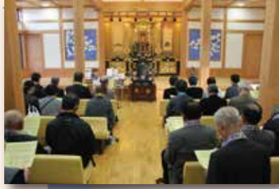
▲こぶしの里恵信尼さま会館

隣には、上越市運営の施設「糸しんの里記念館」と国府別院管理の「こぶしの里恵信尼さま会館」があり、廟所と合わせて3ヶ所を3グループに分けて順に回った。