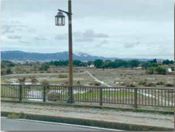
▲台風19号で決壊した、千曲川

決壊地点からここは15キロも下流のところなのに、川幅全体が茶色く変色していて、当時の流れの凄さを思わせるには十分な光景で、絶句した。