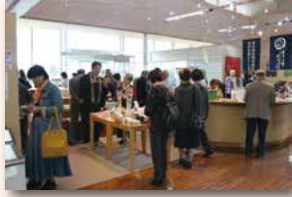
◀糸しんの里記念館

隣には、上越市運営の施設「糸しんの里記念館」と国府別院管理の「こぶしの里恵信尼さま会館」があり、廟所と合わせて3ヶ所を3グループに分けて順に回った。