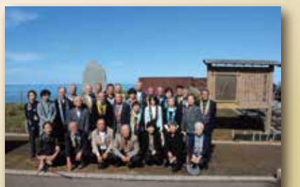
▲居多ヶ浜で記念撮影