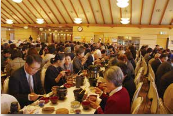
▲「おぎのや長野店」で昼食

1日目は、長野市で昼食をとるために長野インターで高速道路を下りた。駅弁や釜めしでちょっと名の知れているという「おぎのや長野店」で昼食後、川中島古戦場史跡公園を自由散策した。戦国時代の武将・武田信玄と上杉謙信が何度も戦ったという川中島ですが、そこへ行く際に千曲川を渡った。10月初旬の台風19号で決壊した、あの千曲川である。